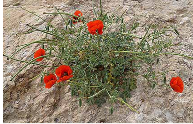
Unikot aavikolla.