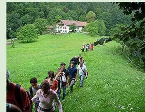
Ensimmäinen Yad b' yad -ryhmä v. 2005.

Siunausta kaikille Suomeen, Yad b' yad -tiimi, Israel