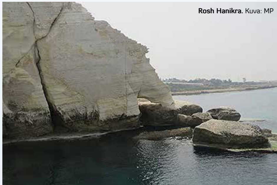
Rosh Hanikra.

distuksia Messiaan muuttavasta voimasta heidän elämässään. Matkan aikana totesimme sen, miten monet uskovat siellä joutuivat maksamaan uskostaan korkean hinnan. Monet heistä totesivatkin minulle, että on suuri asia, kun te uskovina tullette Suomesta asti rohkaisemaan ja seisomaan palan matkaa meidän rinnallamme. Seurakuntavierailut ja messiaanisten tapaamiset toivat sydämiimme tuulahduksen taivaasta. Viimeisenä iltana vierailimme LL:n Raamattu- ja op-koululla. Kuulimme todistuksia, miten Jumala on johdattanut näitä nuoria armeijan jälkeen opiskelemaan Jumalan Sanaa. On suuri etuoikeus olla tukemassa messiaanisia nuoria heidän kutsumuksensa tiellä eteenpäin. Matka oli monin tavoin siunattu ja haluan ihan haastaa rukoukseen ja jopa paastoon juutalaistyön puolesta. Näinä viimeisinä aikoina erityisesti vihollinen vihaa tuota maata ja kansaa mutta Jumalalla on suuri suunnitelma, jonka hän toteuttaa jokaista lupaustaan myöten. Oli ilo nähdä sekin, miten Kristuksessa yksi uusi ihminen on mahdollista elää käytännössä todeksi!