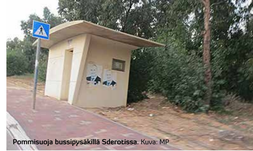
Pommisuoja bussipysäkillä Sderotissa.

ka yhteiskunnassa ovat huumeriippuvuus ja alkoholismi lisääntyneet räjähdysmäisesti. Yhtenä tämän ongelman surullisista ilmiöistä on ihmiskauppa, jossa etenkin nuoria naisia pakotetaan prostituutioon. Päihdevieroitusohjelman ohella Ohel Avraham ylläpitää Tel Avivin seudulla ruokapalvelua. Sen lisäksi Israelissa on muutamia järjestöjä, jotka pyrkivät auttamaan ongelmiin ajautuneita miehiä ja naisia sielunhoito-ohjelmalla, nimenomaan hengellisestä näkökulmasta. Nämä kristilliset järjestöt eivät saa valtion apua. Järjestön keskeinen tavoite on naisten turvakodin avaaminen Israeliin. Päihderiippuvaisen lisäksi kodissa on tarkoitus kuntouttaa naisia, jotka ovat joutuneet Israelissa ihmiskaupan uhreina hyväksikäytetyiksi prostituutiossa ja muussa rikollisessa toiminnassa. Lev Hatsafon tekee Fidan kanssa yhteistyötä holokaustista selvinneitten vanhusten aut-