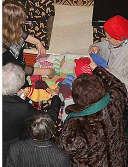
Jokainen sai valita Suomesta lahjoitetut villasukat.

Myös Taly Shaul roasti että 70 vuotta toisen maailmansodan päättymisen ja holokaustin jälkeen on arvokasta juhliä ystävyssuhteiden ja arvojen jälleenrakennusta,