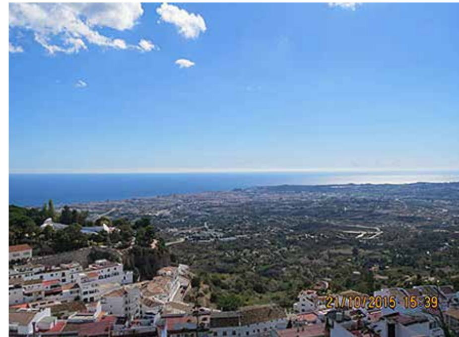
Rukoillaan Espanjan juutalaisten puolesta.

Voit tukea holokaustityötämme Fida International ry Nordea FI4122871800005256 BIC/SWIFT: NDEAFIHH Viite: 412232