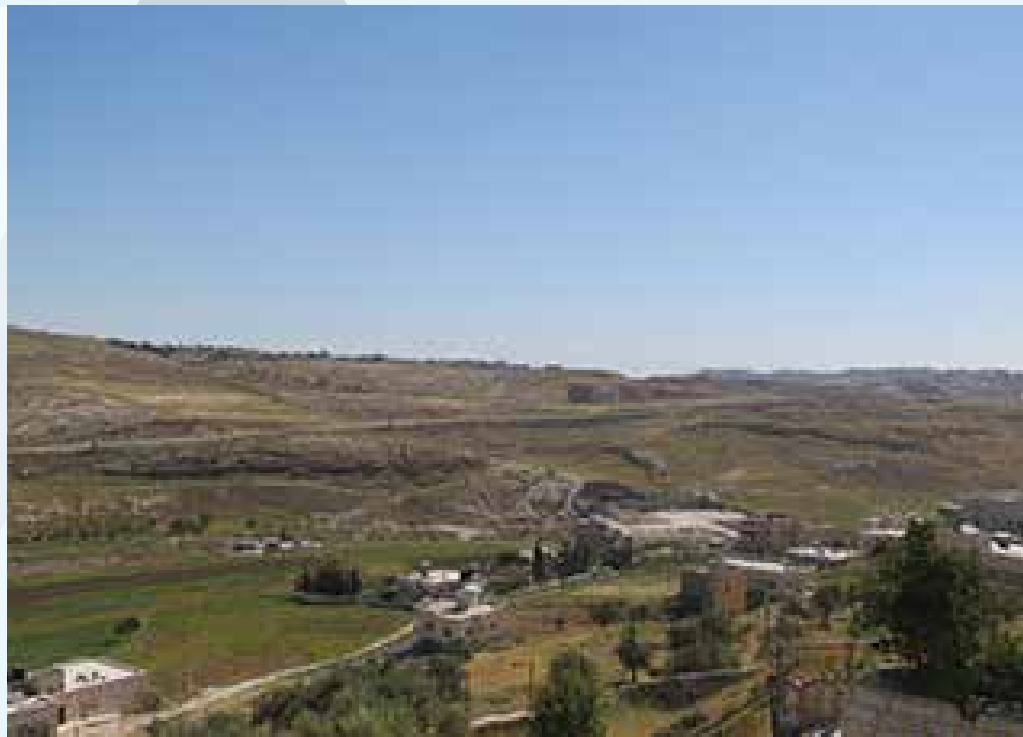
Paimenten keto, Betlehem.

Hän tuli juuri niitä varten, jotka halu-