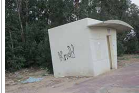
Sderotissa bussipysäkeillä on pommisuoja.

Voit tukea Avainmedian jälkihoitotyötä Israelissa Avainmedia Lähetysjärjestö ry Tili: FI56 8000 1800 1807 55 BIC/SWIFT: DABAFIHH Viite: 130255